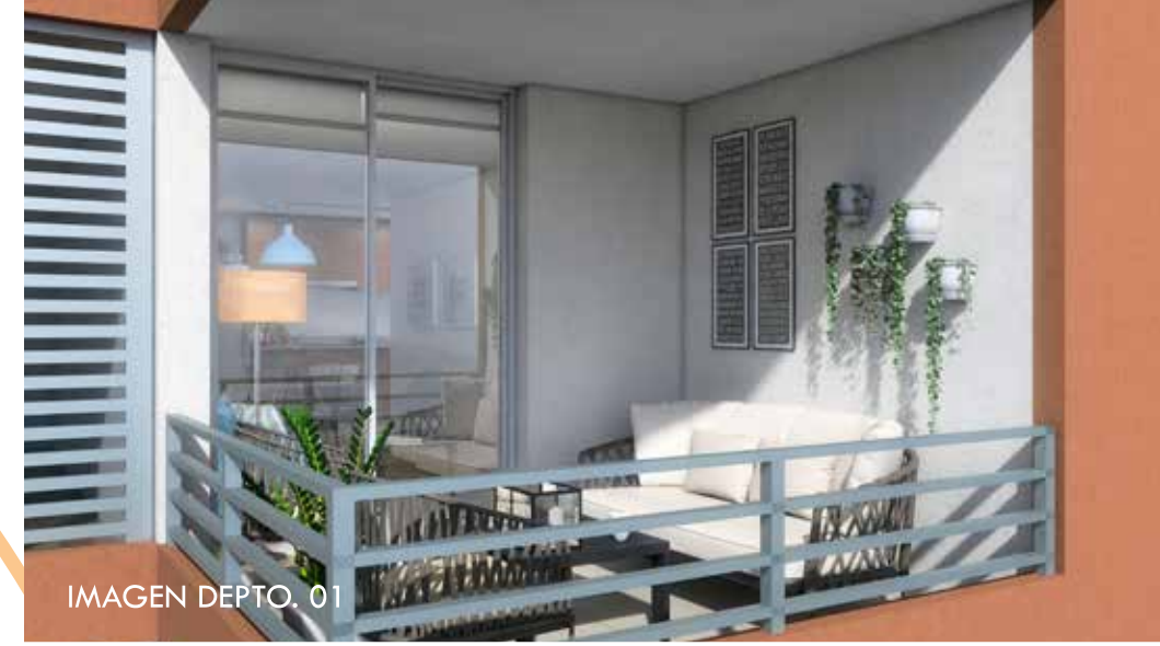
IMAGEN DEPTO. 01