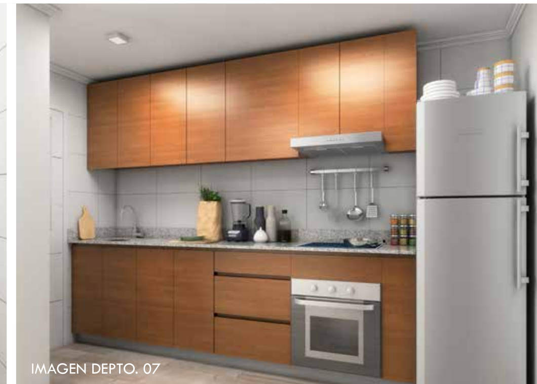
IMAGEN DEPTO. 07