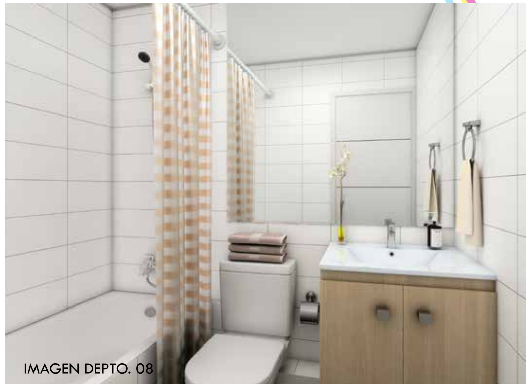
IMAGEN DEPTO. 08