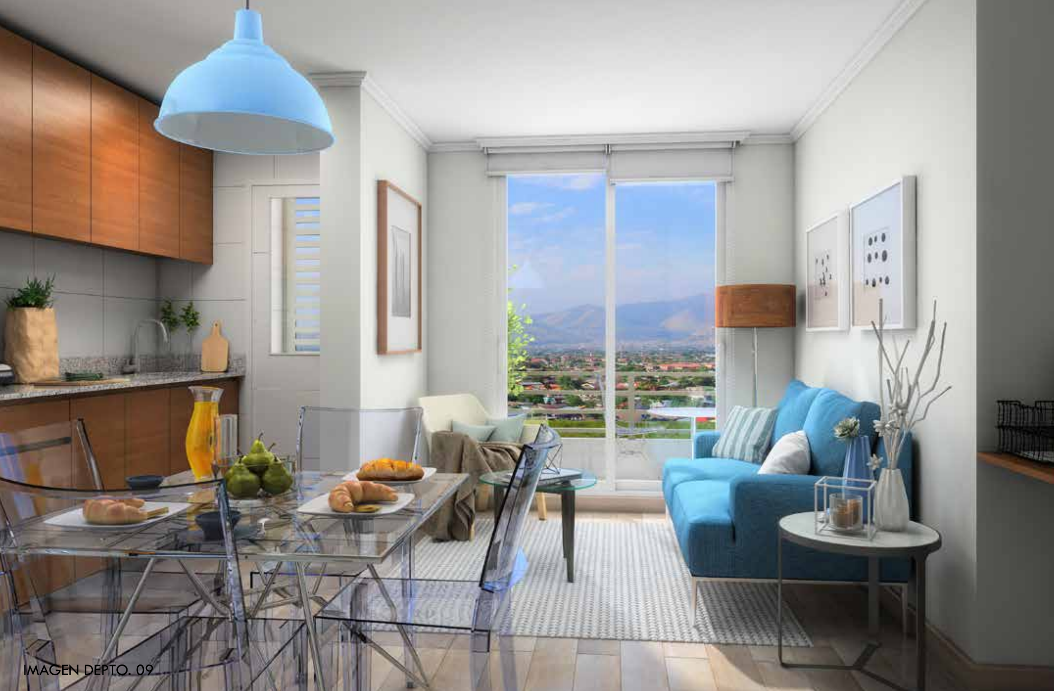
IMAGEN DEPTO. 09